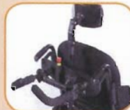
Ofte valgt tilbehør: Ledsagerstyring