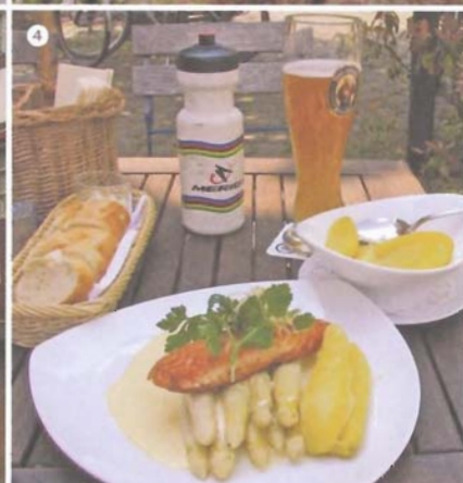
1 Nyløst som ikke fåes i Norge fikk jeg gratis av en sykkelforhandler som var imponert av sykkelan. 2 Opp disse flotte vinrankene går det en trappeheis, som man kan spørre om å få haik med. 3 Landsbyidyll 4 Viktige ingredienser for en vellykket sykkelturn – god mat og drikke