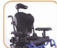
Samba med JAY J3 = god sittestilling!