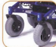
Velg hjul i forhold til hvor du kjører mest.