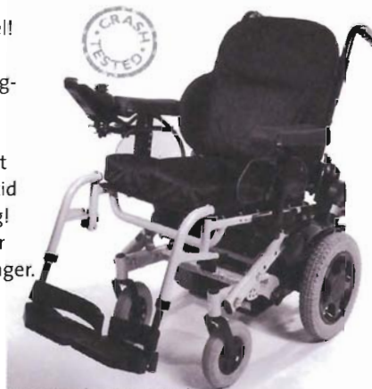
Her er Samba utstyrt med Unistabil komfort rygg, Jay Easy pute og manuell tilt.